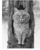
画像:「ねこはるすばん」原画 町田尚子 ぼるぶ出版2020年

子どもたちを対象にした鑑賞会です。特別展「隙あらば猫町田尚子絵本原画展」の鑑賞資料をもとに、作品鑑賞ができます。