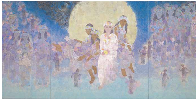
上段左から、 那波多目功一《夕映の松》 宮廻正明《伯耆大山》 手塚雄二《霞野》 小田野尚之《映》 北田克己《朝のために》 西田俊英《妖精の森》 前田力《博物学》 井手康人《月乃神》